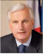
Michel Barnier Ministre de l'Agriculture et de la Pêche

UNE AGRICULTURE, UNE PÊCHE ET UNE FORÊT DURABLES